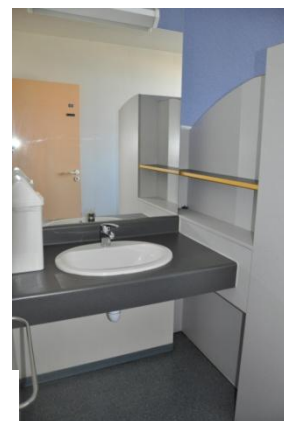
Internat en 2014