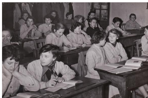
Baraquement en 1954

À la libération en 1944, le lycée est occupé par les Anglais, puis réquisitionné par les bureaux de la mairie (celle-ci ayant été entièrement détruite). Le collège moderne de la rue Saint Jean fusionne avec le lycée de jeunes filles. Peu à peu de nombreux baraquements sont installés dans la cour du lycée Malherbe.