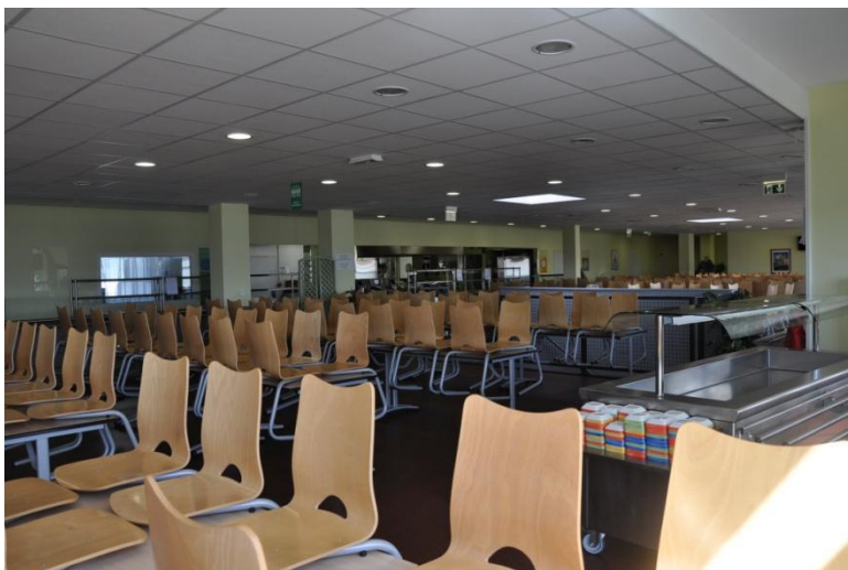
Cantine : 2014