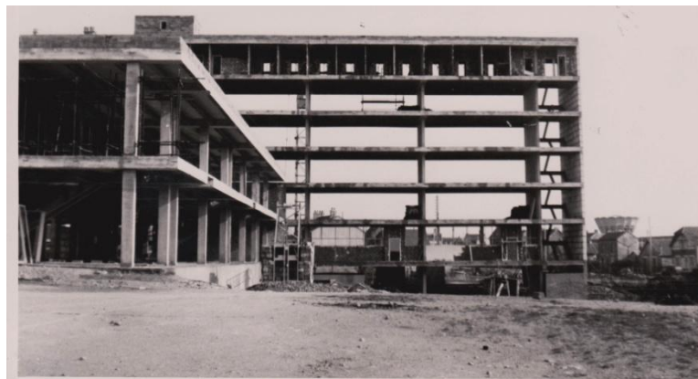
14 février 1960

En 1961-1962, le lycée de jeunes filles ouvre ses portes rue Eutache Prestout et désengorge ainsi le lycée de jeunes filles de la rue Pasteur. Le lycée est construit en 18 mois et peut ainsi accueillir 1300 filles (400 places en internat).