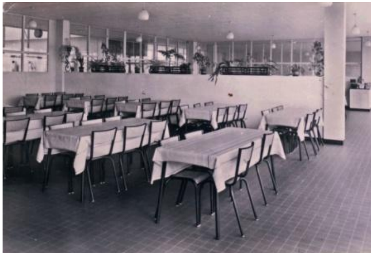
Cantine : 1963

En 2010, la cantine du lycée est entièrement repensée laissant place à une structure plus moderne.