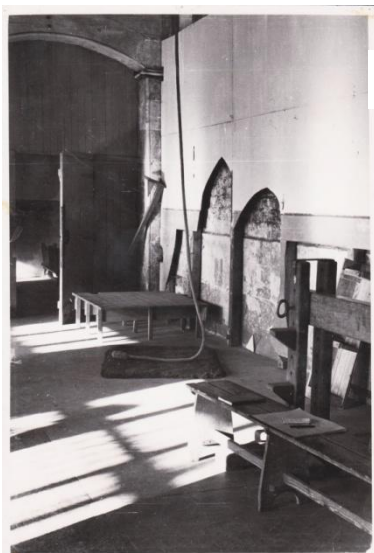
Gymnase en 1954

De 1916 à 1940, le lycée de jeunes filles fonctionne rue Pasteur. En 1933, la 300 ème élève est fêtée au champagne ! Puis de 1940 à 1944, le lycée est occupé par les Allemands (en hôpital), excepté les bureaux de l'administration. Les filles durant cette période travaillent dans « le couloir des classes » du lycée Malherbe, de 09h30 à 13h00 (tard le matin par mesure d'économie d'électricité) et les garçons de 13h30 à 17h00. Quant aux classes du primaire, elles sont hébergées au rectorat.