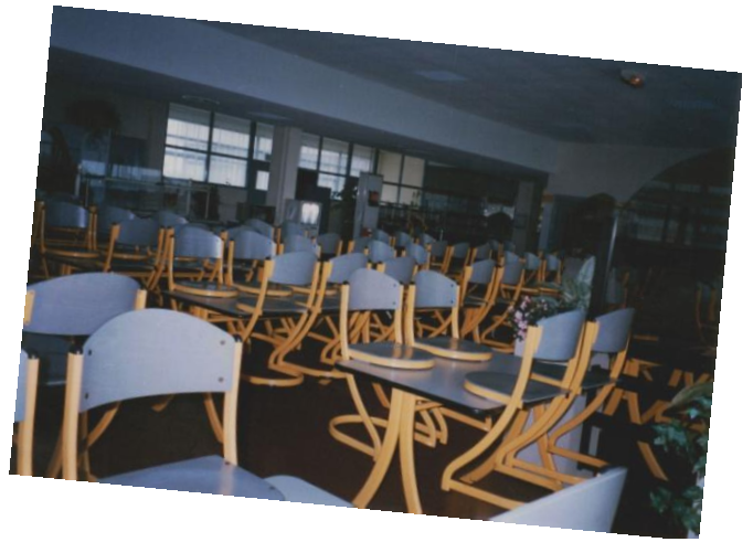
Cantine : 1990